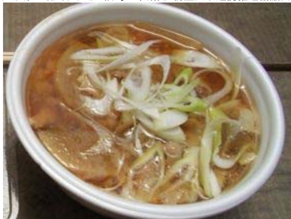
宮城のいも煮(イメージ)

山形県は〈仙台・山形・福島三市観光・物産広域連携推進協議会〉のコーナーにて販売いたします。