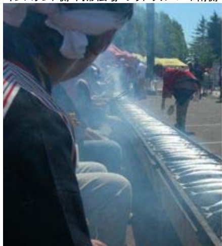
気仙沼さんま祭りの様子