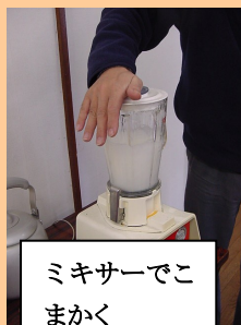
ミキサーでこまかく